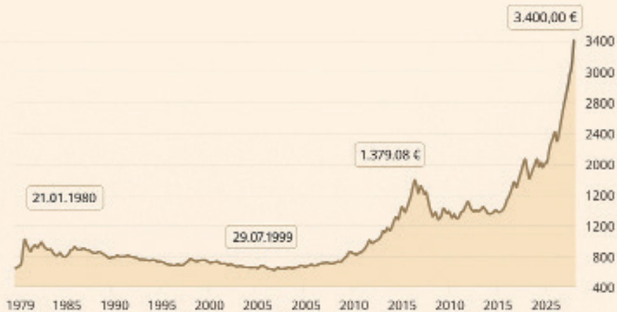
Goldpreis in Euro 1979-2025